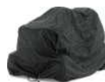
505 63 08-82 Kapell till traktor

För alla 12V bly-syra batterier från 1.2-32Ah, såsom batterier i Riders och traktorer etc. Laddaren är lämplig för underhållsladdning upp till 100Ah. Perfekt för batteristartade säsonsprodukter. Helautomatisk uppladdning och underhållsladdning som maximerar batteriets funktion och livslängd. Inga gnistor, kortslutningssäker och skyddad mot omvänd polaritet ger enkel användning. Vattenresistent (IP 65) för utomhusanvändning, även vid nederbörd, sommar som vinter. Används, med fördel, tillsammans med Husqvarnas Batteristatusindikator.