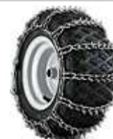
964 99 43-01 Snökedjor

För montering på snöblad för att skydda underlaget från att bli skadat av stålskåret. Passar snöblad 544 92 17-01.