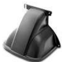
960 71 00-41 Deflektor

Fästordning i hållbart stål med universalkoppling. Mossrivare och vertikalskärare kan kopplas på. De olika tillbehören går snabbt och enkelt att sätta dit tack vare det verktygslösa snabbkopplingssystemet. Kräver mindre förvaringsutrymme i jämförelse med separata verktyg.