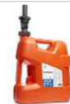
580 75 45-01 Bensindunk 15 Liter

För traktorer med integrerad uppsamling. Konvertera din traktor från uppsamling till bakutkast. Med hjälp av en deflektor kastas klippen bakåt och nedåt.