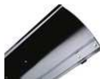
966 00 19-01 Gummiskär