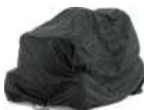
505 63 08-82 Kapell till traktor

Kapell för traktor i vattenavvisande nylon med ventilation. Justerbart dragsnöre nedtill. Passar traktorer med uppsamlare.