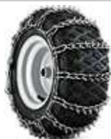
964 99 43-01 Snökedjor

Snökedjor till bakhjul på traktorer med däckdimension 18x8,5". Ger bra grepp vid körning på snö och is.